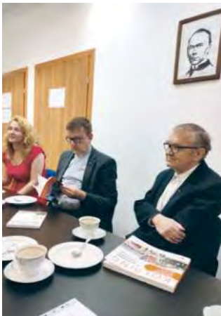
Z przedstawicielami Rodziny Kolpinga w Wadowicach.

Karola Wojtyły – wspólnie odwiedziliśmy bazylikę p.w. Ofiarowania Najświętszej Maryi Panny oraz Muzeum Dom Rodzinny Ojca Świętego Jana Pawła II.