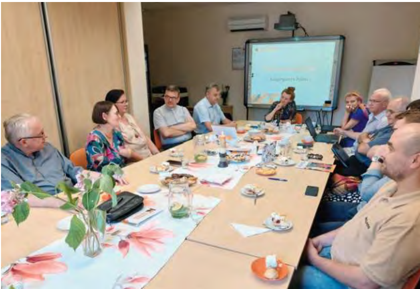
Spotkanie z Zarządem Związku i pracownikami biura w Krakowie.

nieść ją ludziom, którzy jej potrzebują, np. starszym czy samotnym”. Umożliwiają w ten sposób wzajemne spotkanie, choćby na obiedzie w niedzielę. Można się wtedy ładnie ubrać, ucieszyć obecnością drugiego człowieka, być dumnym z siebie i wspólnoty.