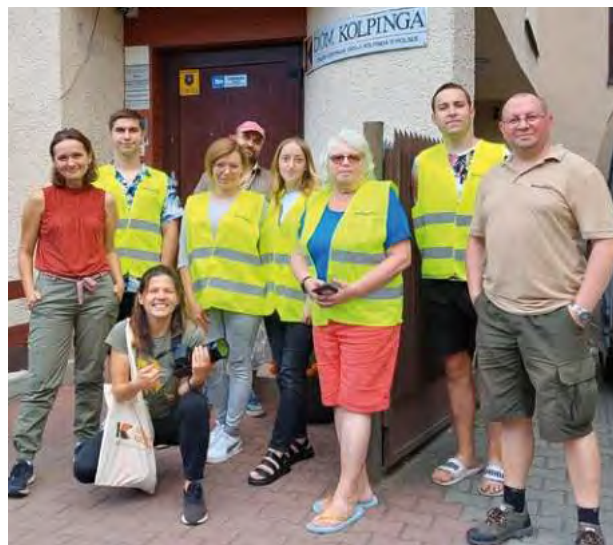
Wolontariusze wspierający nas w pakowaniu 8. transportu z pomocą humanitarną: uchodźcy z Ukrainy, pracownicy polskiego „Kolpinga” oraz dziennikarki „Głosu Ameryki”.

Szczególne podziękowania chcielibyśmy skierować do następujących osób: