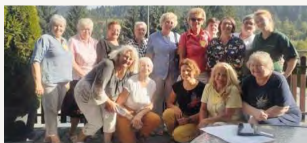
Uczestniczki szkolenia w Rabce-Zdroju.