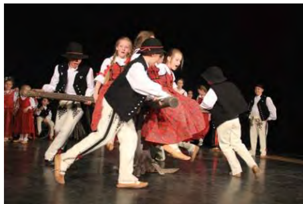
Na próbach i występach dajemy z siebie wszystko!

– W 2018 r. zdobyliśmy drugie miejsce w konkursie na najpopularniejszy zespół regionalny na Orawie. W kolejnych latach nasze dzieci i młodzież zostały docenione m.in. podczas Sabatowych Bajań w Kościelisku, konkursów: Kapel i Śpiewaków Ludowych w Kazimierzu Dolnym, Muzyk Podhalańskich, Orawskiego Zbyrcoka, Przednówka na Polanach, Złotego Kłosa czy w czasie Karpackiego Festiwalu Dzie-