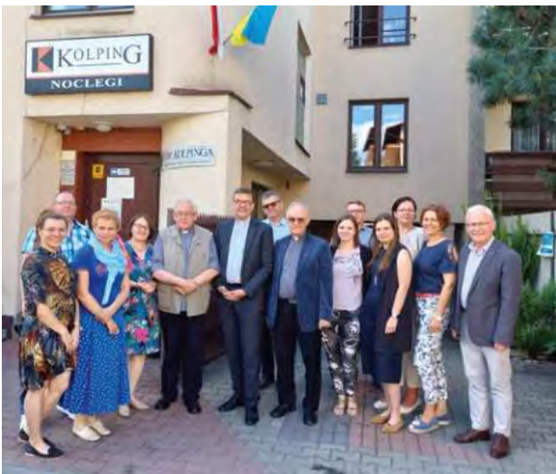
Spotkanie z Zarządem i pracownikami.

Wizytę rozpoczął w podkrakowskiej Luborzycy. To tu znajduje się Dom Spotkań i Formacji Dzieła Kolpinga, będący od początku lat 90-tych XX w. świadkiem wielu ważnych wydarzeń w historii naszego Związku. Lokalna Rodzina Kolpinga z radością przyjęła zacnego gościa w swoich progach.