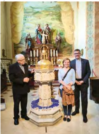
Przy wadowickiej chrzcielnicy, w której chrzest przyjął św. Jan Paweł II.