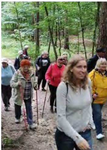
Spacer po Puszczy Niepołomickiej.