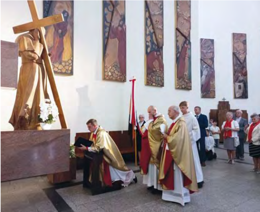
Modlitwa w Bochni przy relikwiach bł. ks. A. Kolpinga i św. Jana Pawła II.