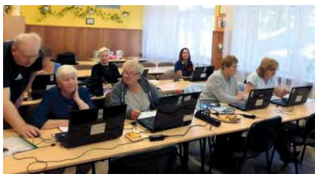
„Kurs e-obywatel” w domu parafialnym w Krakowie-Nowym Bieżanowie.

– Jestem bardzo zadowolona, że takie szkolenia są organizowane – mówi mieszkanka krakowskiego osiedla Nowy Bieżanów. Bierze udział w zajęciach odbywających się w budynku domu parafialnego,