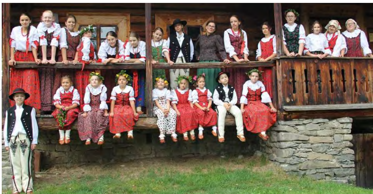
Przy naszym stowarzyszeniu działa wielopokoleniowy zespół folklorystyczny: Małolipnicka Rodzina Kolpinga.