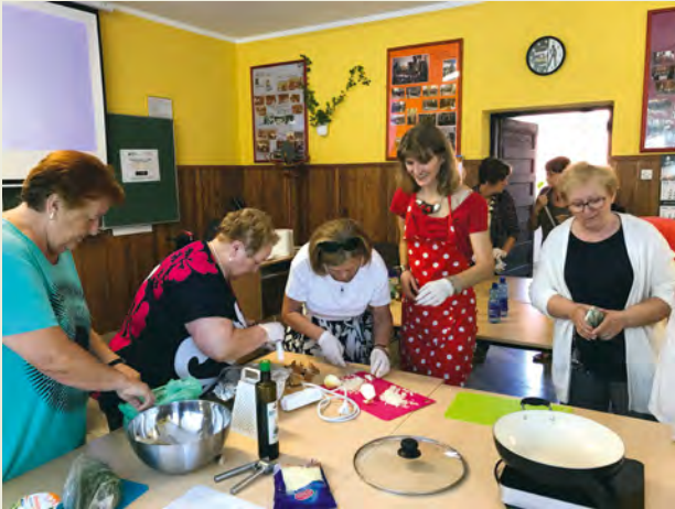
Zajęcia z zakresu zdrowej diety.

radości innym. Ostatnie trzy lata senioralnej działalności teatralnej realizowanej pod nazwą „Radosna Gromada”, przyniosły nam zadowolenie, a zgromadzonej na przedstawieniach publiczności – rozrywkę i uśmiech na twarzy. Z dwoma przedstawieniami uczestniczyliśmy w przeglądach twórczości senioralnej pod patronatem Marszałka Województwa Małopolskiego „Starsi Panowie Dwaj”, w ramach którego