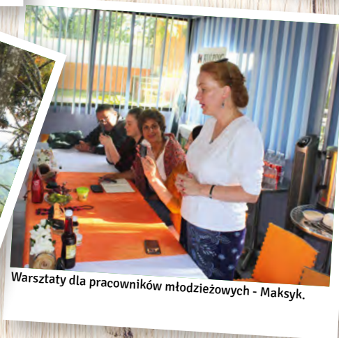
Warsztaty dla pracowników młodzieżowych - Meksyk.