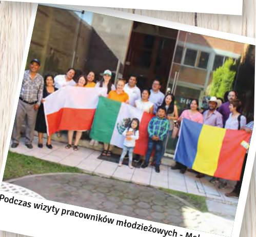
Podczas wizyty pracowników młodzieżowych - Meksyk.