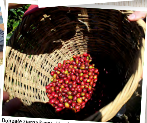
Dojrzałe ziarna kawy - Honduras.