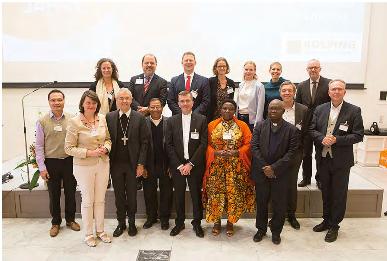
Uroczystość jubileuszu 50-lecia działalności Międzynarodowego Dzieła Kolpinga.