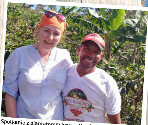
Spotkanie z plantatorem kawy - Honduras.