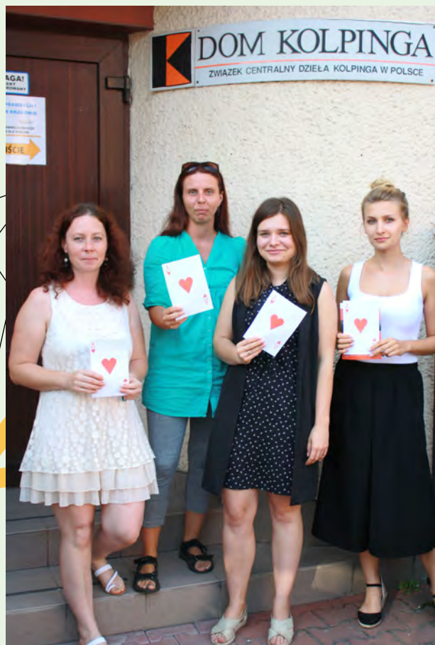
Zespół projektu Aktywni i Samodzielni.