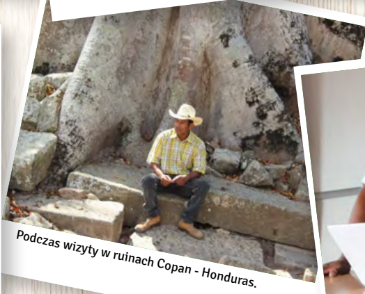
Podczas wizyty w ruinach Copan - Honduras.