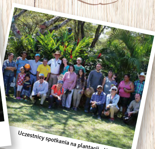
Uczestnicy spotkania na plantacji - Honduras.