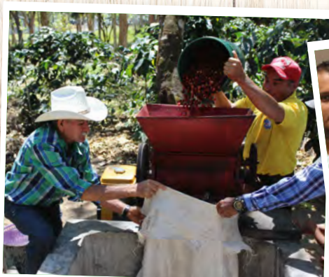
Plantacja kawy Fianco el Naciente w Hondurasie.