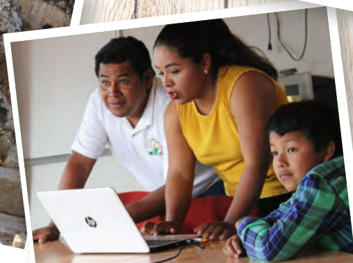
Spotkanie z rolnikami w Meksyku.