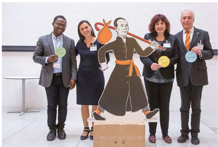
Zdjęcie pamiątkowe.

bieta i każdy mężczyzna ma duże możliwości i jest w stanie wprowadzić zmiany w swoim życiu. Czasami ludzie potrzebują tylko wsparcia i pomocy, aby rozpocząć zmianę. Kolping Międzynarodowy podczas realizacji swoich projektów niejednokrotnie był świadkiem tego, że ludzie, nawet najbiedniejsi są bardzo silni, potrzebują tylko kogoś, kto w nich uwierzy i zapewni im wsparcie. Wtedy rozwój oso-