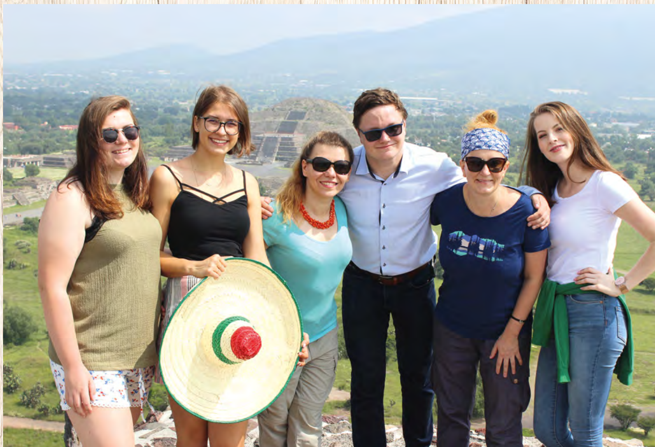
Uczestnicy młodzieżowego spotkania w Meksyku.

Rok 2019 obfitował w spotkania organizowane przez Dzieło Kolpinga. Spotkaliśmy się w gronie kolpingowskich seniorów na Senioriadzie w Szczawnicy, były wzajemne odwiedziny Rodzin Kolpinga z Małopolski oraz międzynarodowe warsztaty w Słowenii. Odbyło się wiele innych wartościowych wydarzeń, na których mogliśmy się wzajemnie inspirować, wymienić dobrą energią, pracować nad wzmocnieniem Dzieła Kolpinga i wprowadzaniem pozytywnych zmian w świecie. Ale szczególnie wyjątkowe były trzy spotkania, na których obecni