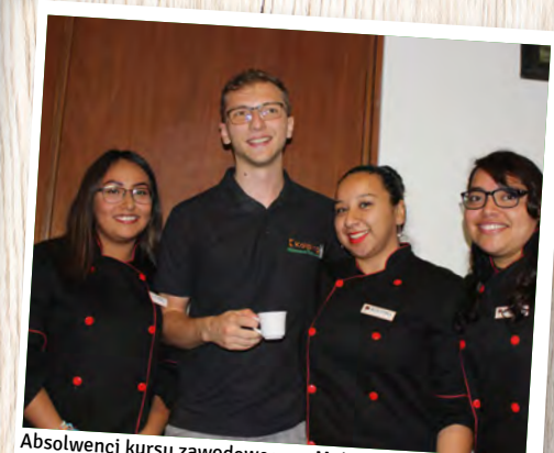
Absolwenci kursu zawodowego w Meksyku.