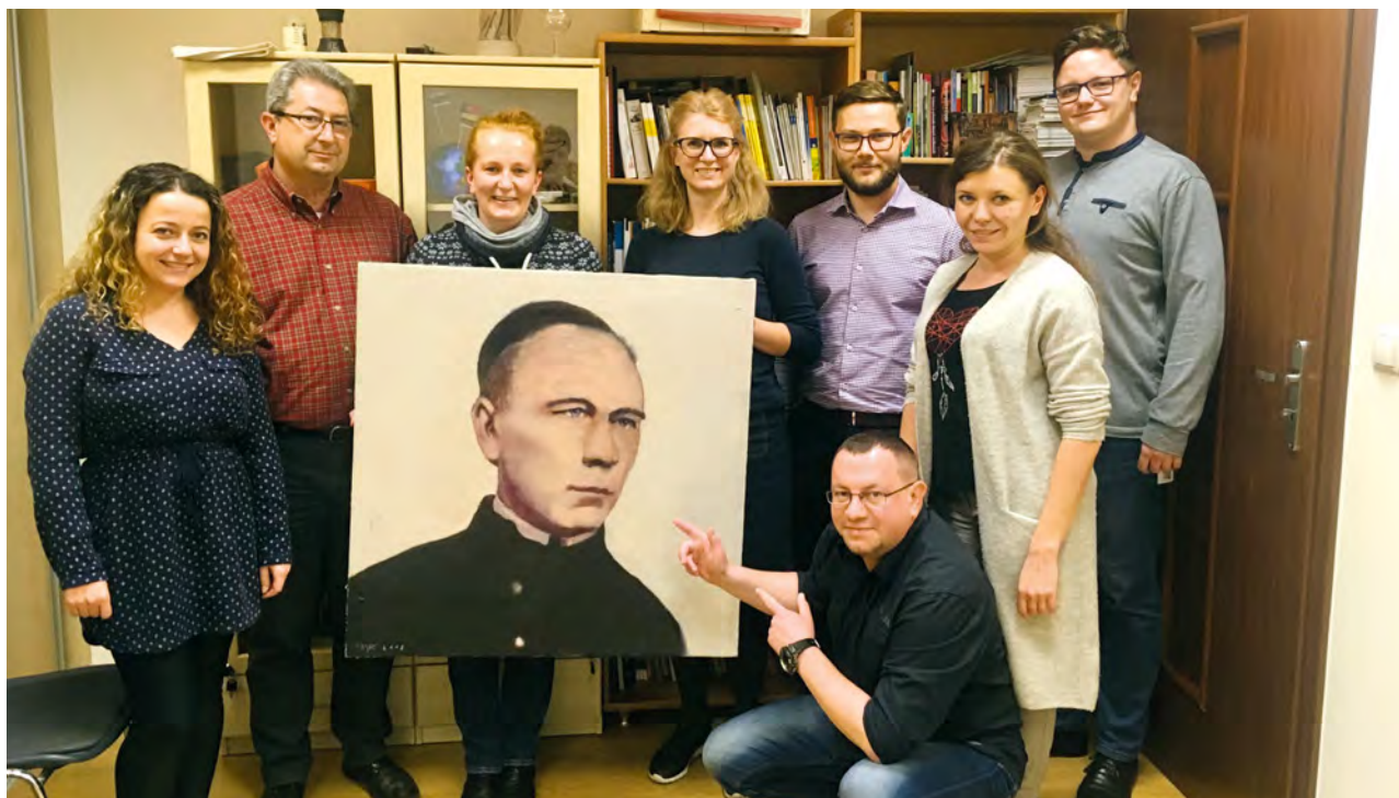
Członkowie Stowarzyszenia RK Jeden Świat podczas spotkania założycielskiego.

Kiedy na swojej drodze spotykasz osoby, które tak jak Ty chcą działać na rzecz pozytywnych zmian społecznych – zaczynasz myśleć o wspólnym założeniu organizacji pozarządowej. Jeśli na dodatek osobom tym bliskie są kolpingowskie idee samopomocy i braterstwa między ludźmi, to znak, że nadszedł czas na powołanie do życia nowej Rodziny Kolpinga. Tak właśnie stało się w jeden z listopadowych wieczorów w Krakowie.