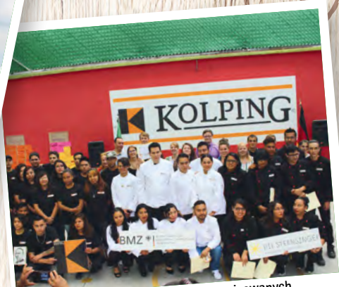
Absolwenci kursów zawodowych organizowanych przez Dzieło Kolpinga w Meksyku.