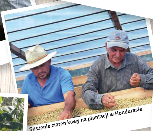
Suszenie ziaren kawy na plantacji w Hondurasie.