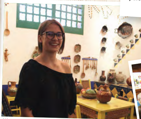
Wizyta w Muzeum Fridy Kahlo w Meksyku.