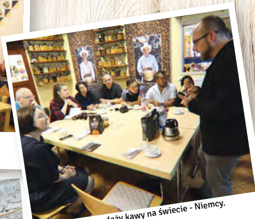
Warsztaty ze sprzedaży kawy na świecie - Niemcy.