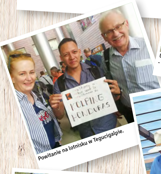
Powitanie na lotnisku w Tegucigalpie.