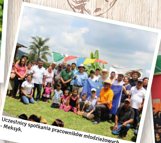
Uczestnicy spotkania pracowników młodzieżowych - Meksyk.