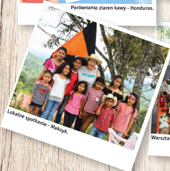
Lokalne spotkanie - Meksyk.