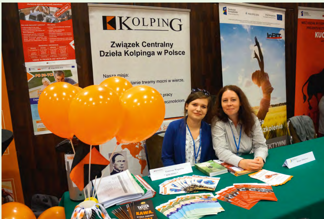
Przedstawicielki biura projektu na Kongresie Ziemi Krakowskiej.

Projekt „Aktywni i Samodzielni (AS) – skuteczna szansa na rozwój zawodowy dla osób 30+”, to program przeznaczony dla niepracujących osób z Małopolski, które ukończyły trzydziesty rok życia. Głównym założeniem projektu jest zwiększenie poziomu zatrudnienia na lokalnym rynku pracy. Narzędziami służącymi Uczestnikom Projektu w osiągnięciu założonego celu są staże zawodowe, zatrudnienie subsydiowane a także bony szkoleniowe. Od czerwca 2018r. do września 2019r. opieką Centrów Wsparcia Kolping w Krakowie, Brzesku, Wadowicach i Oświęcimiu, zostało objętych 125 Uczestników Projektu. Docelowo, naszą pomocą, wiedzą i doświadczeniem otoczymy 140 Małopolan.