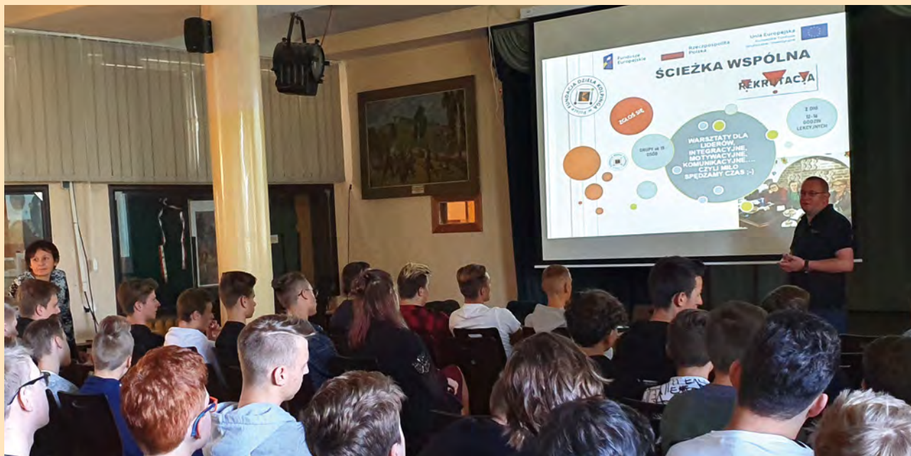
Spotkanie informacyjne w krakowskiej szkole.

Rekruterzy oraz specjaliści zarządzania zasobami ludzkimi przekonują, że pracę otrzymuje się w 70% dzięki wiedzy fachowej i w 30% dzięki zdolnościom społecznym. Traci się ją zaś w 70% przez brak zdolności społecznych i w 30% z braku kwalifikacji merytorycznych. Jaki z tego wniosek? Już od najmłodszych lat powinno się pracować nad kompetencjami społecznymi przydatnymi w pracy. Właśnie dlatego Dzieło Kolpinga w Polsce rozpoczęło realizację projektów wzmacniających te kompetencje, adresowanych do młodych ludzi w wieku 15-29 lat. Jeden z nich realizowany jest przez Fundację Dzieła Kolpinga w Polsce.