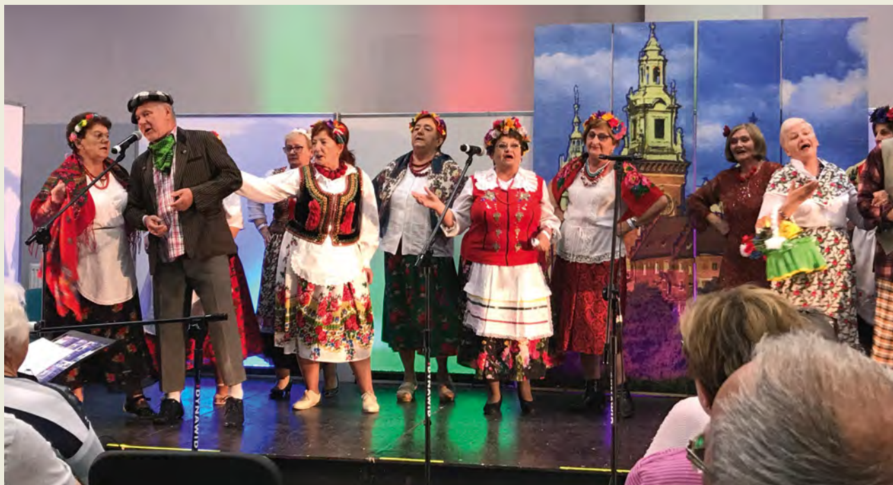
Występ teatru Radosna Gromada.

Rok 2019 jest wyjątkowym rokiem w historii Rodziny Kolpinga w Krakowie Nowym Bieżanowie. Obchodziliśmy dwa ważne jubileusze, które wpłynęły na nasz rozwój i działanie – dwudziestopięciolecie partnerstwa z Rodziną Kolpinga z Bochum-Linden oraz pięciolecie powstania Klubu Seniora przy naszej Rodzinie. Skłania to do refleksji i podsumowań.