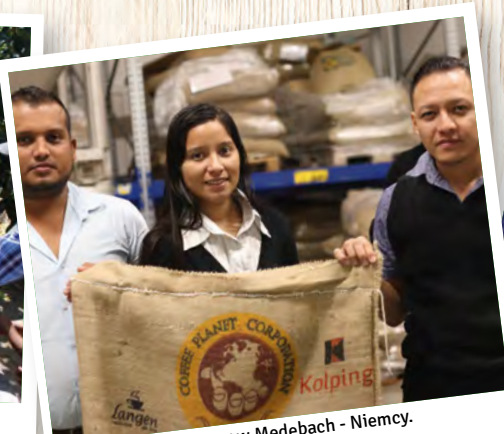
Wizyta w palarni kawy w Medebach - Niemcy.