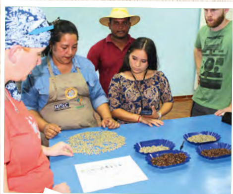
Porównanie ziaren kawy - Honduras.