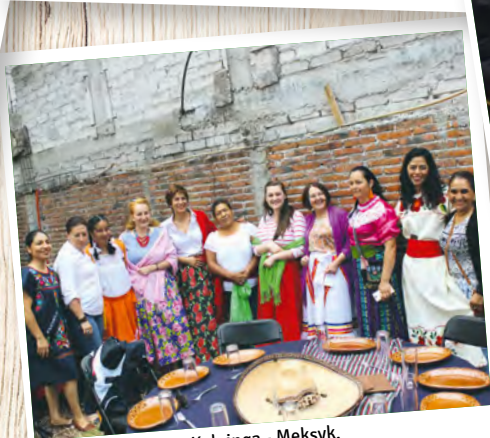
Z wizytą u Rodziny Kolpinga - Meksyk.